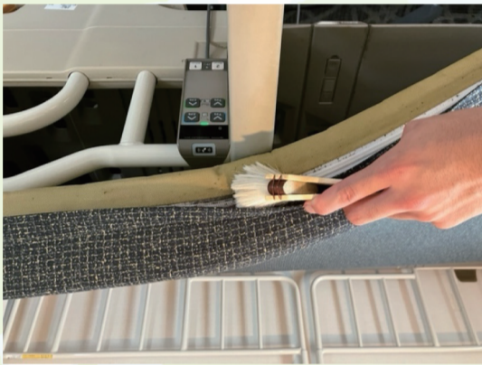
施工員ブログ 隙間とゆう隙間に...

最近気温が下がってきており過ごしやす季節になってきましたね！ 秋が待ち遠しいです 気温も落ち着いてきており害虫などを見かけなくなってきたかと思いますが、自動的 に拒絶は絶対にはしません。 特にトコジミなどは目でも確認をすることが難しく隙間とゆう隙間に巣を作ります。隙間を狭くしていき、 市販の薬剤などは隙間まで薬が届かず持続効果も薄い為駆除は難しいです。 FCCではハケを使い隙間にしっかり薬が浸透するよう細かな作業を行っております！ご自身での駆除に限界を感じたりお困りの際 はぜひご相談下さい！