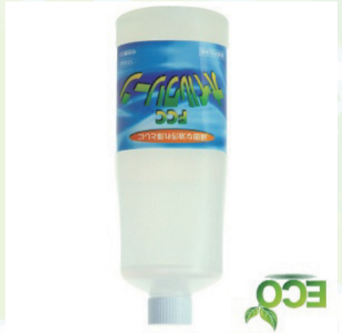
FCC オイルクリーナー

FCC® オイルクリーナーは非イオン系界面活性剤が油そのものを乳化させ、包み込む事で油そのものの性質を消失させます。その為、中性洗剤ですが油汚れを落とす事に非常に特化しており、しつこい油污れ全般に効果的な商品となっております。 一般の洗剤とは違う働きで、強力に油を超微粒子に分散させます。